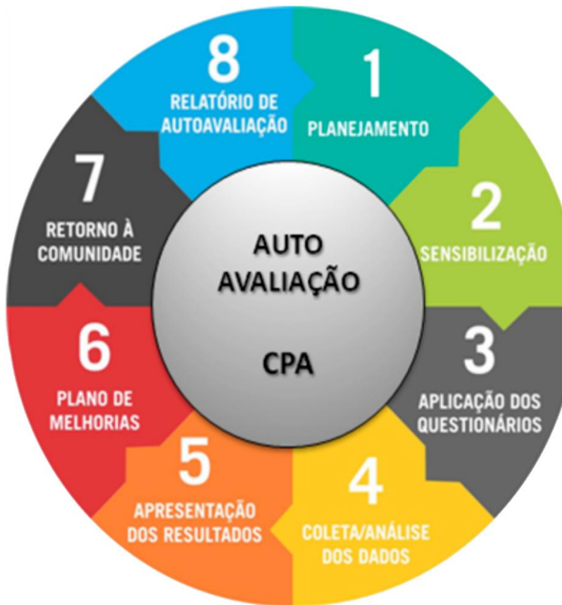
Figura 1: Representação das fases da autoavaliação da CPA